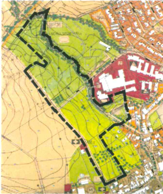
Flächenumgriff 28. Änderung des Flächennutzungsplanes