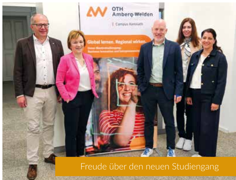
Freude über den neuen Studiengang