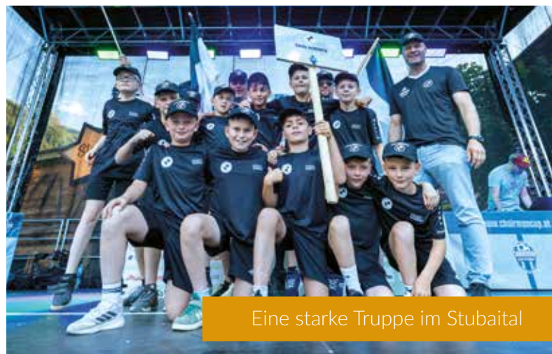
Eine starke Truppe im Stubaital

Anschließend stand das Wochenende im Zeichen des Fußballs. Die Kemnather Jungs trafen auf Gegner aus Österreich, der Schweiz, Griechenland und Italien und spielten sich in einem starken Teilnehmerfeld auf die hinteren Tabellenränge. Vor einer beeindruckenden Kulisse von täglich mehr als 2.000 Besuchern sammelten die jungen Kicker wertvolle Erfahrungen und präsentierten sich mit großem Einsatz und Teamgeist.