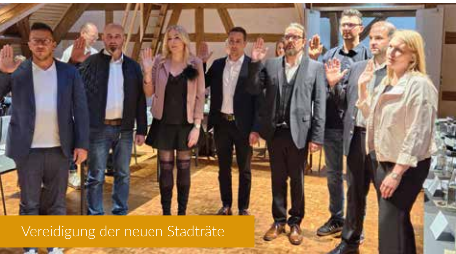
Vereidigung der neuen Stadträte