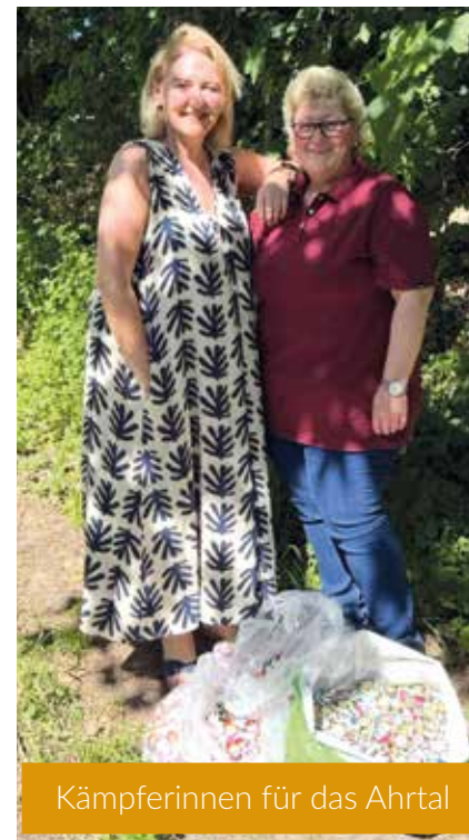
Kämpferinnen für das Ahrtal

Die Sammelaktion läuft bis November 2026. Dann soll gemeinsam ein Container voller Kronkorken und Schraubdeckel übergeben werden. Abgegeben werden können die gesammelten Deckel unter anderem bei der Schustermühle Eisersdorf und im Altstadtldl Kemnath. Wer die Aktion unterstützen oder weitere Informationen erhalten möchte, kann sich an folgende E-Mail-Adresse wenden: regina@paten-fuer-katastrophenopfer.de