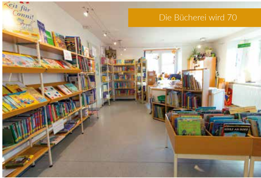
Die Bücherei wird 70

Im Februar hatte bereits das mittlerweile schon traditionelle „Blind Date mit einem Buch“ den Anfang gemacht. Aktuell läuft die Kommunionausstellung bis einschließlich 07. April. Hier können tolle Artikel und Geschenksets zur Kommunion in der Bücherei besichtigt beziehungsweise erworben werden. Unter anderem gefilzte Einbände für Gebetbücher mit passenden Rosenkranztäschchen, Glückwunschkarten, Deko und Geschenksets. Für Kinder werden im April wieder Vorlesestage mit Lesepatzen stattfinden.