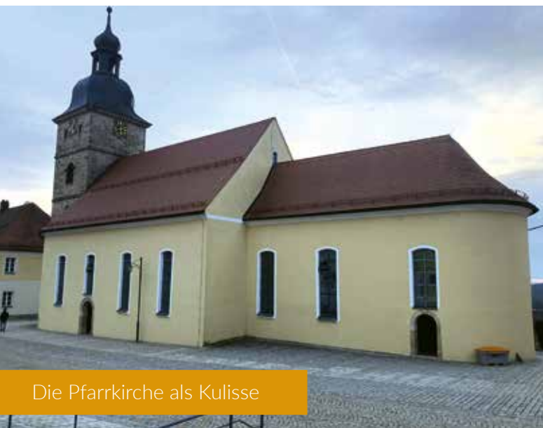
Die Pfarrkirche als Kulisse

Das seit über 100 Jahren bei den Salzburger Festspielen aufgeführte Stück wurde im Sommer 2023 auf der Burg Leuchtenberg vor sieben ausverkauften Vorstellungen und damit rund 1500 Besuchern frenetisch gefeiert. „Für uns Grund genug, das Stück noch einmal auf den Spielplan zu setzen. Und das Erfolgsensemble bleibt auch unverändert“, kündigt Meidenbauer an. Mit dem „Jedermann“ macht das LTO in diesem Sommer an verschiedenen Orten Station – vom Denkenbauernhof im Freilandmuseum Neusath über die Naturbühne Schönberg in Grafenwöhr und den Platz vor der Wieskapelle Speinshart bis hin zur Vorstellung in Waldeck.