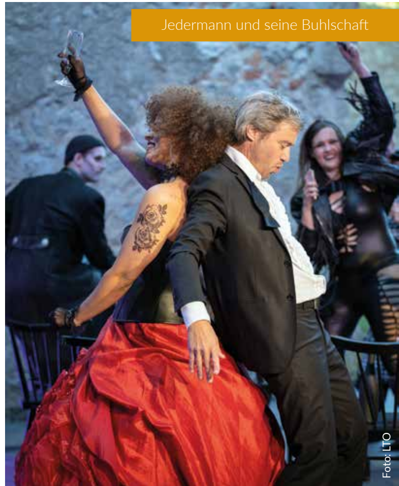
Jedermann und seine Buhlschaft