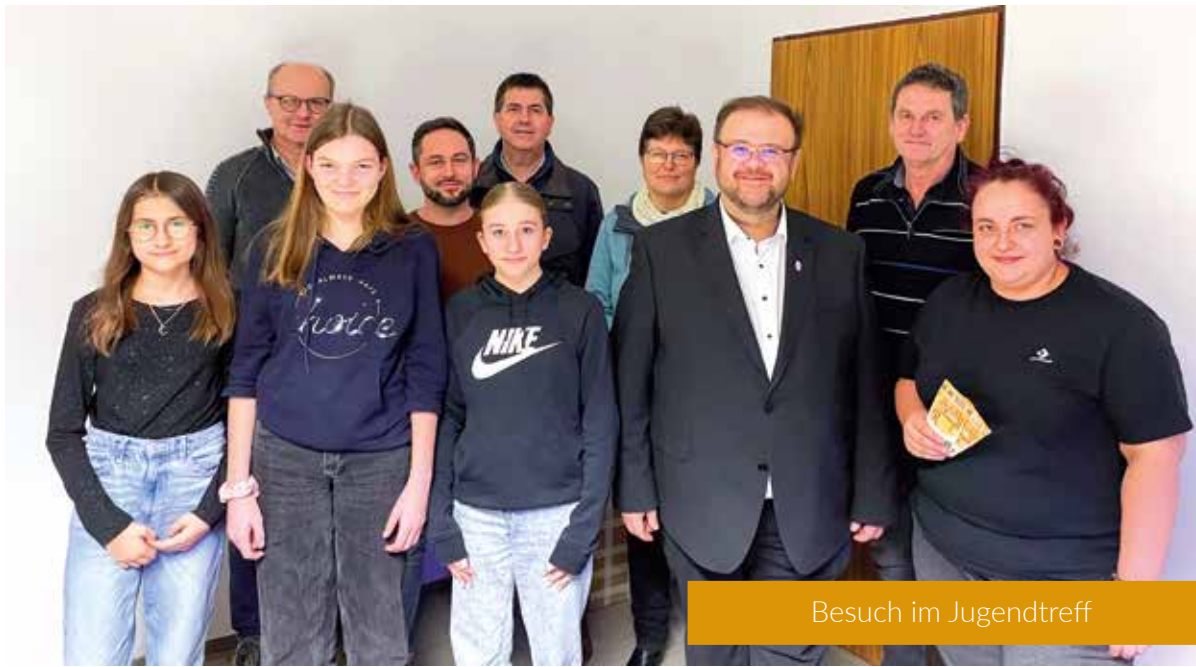
Besuch im Jugendtreff

beschloss das Gremium dieses Angebot zunächst auf zwei Jahre begrenzt, um den Kindern und Jugendlichen der Gemeinde Kastl eine Anlaufstelle bieten zu können.