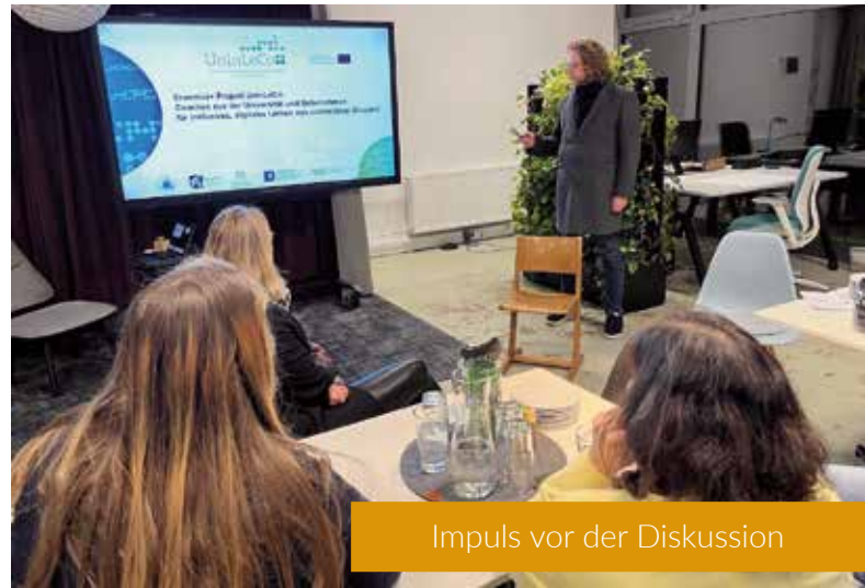
Impuls vor der Diskussion

selbst fokussieren zu können und herauszufinden, was wirklich zu einem passt, ist eines der Ziele ihrer Arbeit.