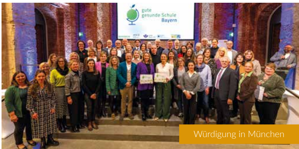
Würdigung in München

Die Gesundheitsförderung aller Mitglieder der Schulfamilie ist ein unverzichtbares Element der Schulentwicklung an der Grund- und Mittelschule Kemnath. Im Schuljahr 2023/2024 beteiligte sich die Schule erstmals am Landesprogramm „gute gesunde Schule Bayern“. In zahlreichen Aktionen und Projekten wurde der Schwerpunkt auf die Bereiche „gesunde Ernährung“ und „Bewegungsförderung“ gelegt. Unterstützung erhielt die Schule auch durch den Sachaufwandsträger. Es wurden Spieltonnen angeschafft und ein Großspielgerät im Pausenhof aufgestellt, auf dem die Schülerinnen und Schüler begeistert klettern und turnen. Das Engagement der Schule wurde mit der Auszeichnung „gute gesunde Schule Bayern 2024“