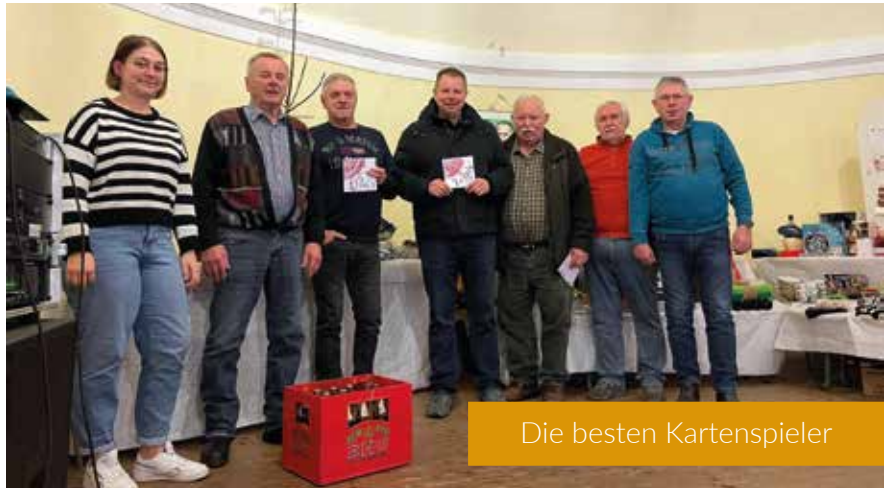
Die besten Kartenspieler