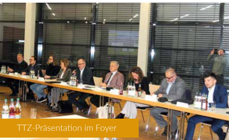
TTZ-Präsentation im Foyer

Zum offiziellen Projektbeginn am 2. Mai 2025 haben bereits Herr Ministerpräsident Markus Söder und Herr Wissenschaftsminister Markus Blume ihre Teilnahme fest zugesagt und unterstreichen damit die mit der Errichtung von TTZs erwarteten Impulse