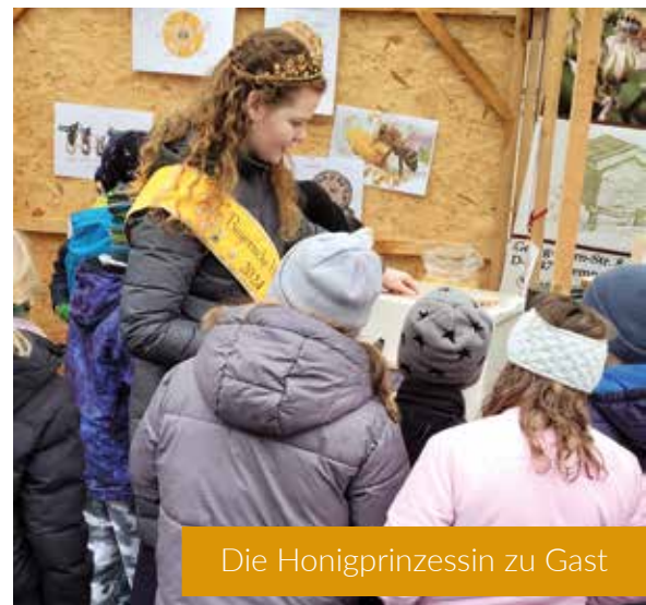
Die Honigprinzessin zu Gast